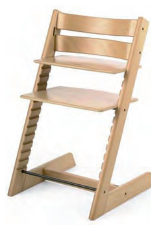
... in wezen een (in)schatting?

lijk, kunt vervangen door de ontwikkeling van nauwkeu- riger begrippen. De eerste stap daartoe is het doorgronden van de betekenis. Mij bleek dat de taalkundige betekenis een breed begrip is, als aanduiding van een elementair niet bewust stuurbaar mentaal proces, respectievelijk van de 'weinig verbale' resultante daarvan. Wanneer wij die aan- duiding gebruiken als maatstaf na 'de enkelvoudige waar- neming' (één oogopslag) en/of de meervoudige waarneming (de Stokke leer) en hem geschikt achten vanwege de gebo- den ruimte voor de vele inschattingen, dan moge duidelijk zijn dat er alle reden is om zeer kritisch te zijn over het begrip totaalindruk als rationele maatstaf.