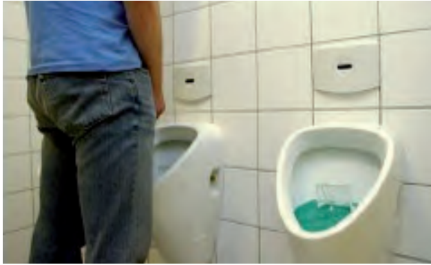
De context bepaalt functie, betekenis en indruk van het object 15

Tot zover de elementaire verkenning van het begrip indruk. Met de door deze verkenning in kaart gebrachte betekenis van het begrip indruk gaan wij nu bezien hoe het begrip wordt toegepast in het auteursrecht en de toegepaste kunst.