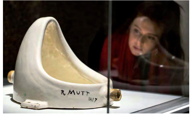
een indruk is relatief

Wanneer men zich rekenschap geeft van de zo-even beschreven bandbreedte van het begrip ‘indruk’, te weten van de overwegend zintuiglijke ‘directe indruk’, zoals bij een prikkelend beeld, tot de meer cerebrale, uitgekristalliseerde, of althans achtergebleven indruk na lezing van een roman, dan valt op Quaedvliegs enthousiasme voor de bruikbaarheid van de totaalindruk, ongeacht de complexiteit van een werk, op het eerste gezicht weinig af te dingen. Bij nadere beschouwing trekken wij echter zowel bij de indruk van