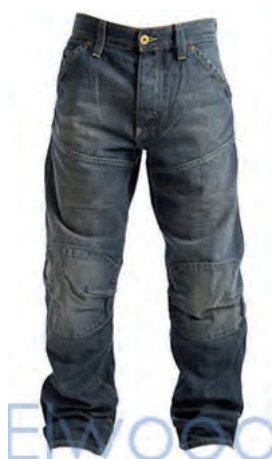
... enkelvoudige waarneming